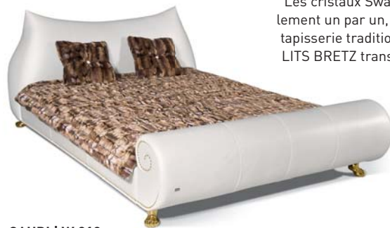
GAUDI | W 210

Les cristaux Swarovski, les clous métalliques appliqués manuellement un par un, les faufiletages artisanaux sont des témoins de la tapisserie traditionnelle de 117 ans à Gensingen, Allemagne. Les LITS BRETZ transforment nos chambres – soient-elles petites ou grandes – en résidences royales.