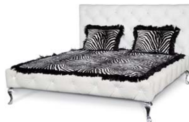
MARILYN | W 140